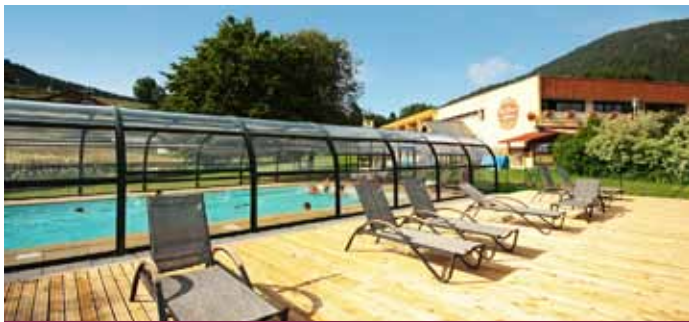
LES CÎMES DU LÉMAN

Destination lac et ville d'Annecy en été et hiver. Nombreuses excursions dans la région.