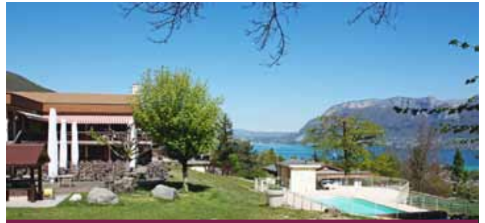
LES BALCONS DU LAC D'ANNEY