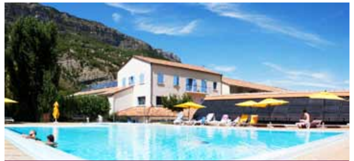
LES LAVANDES DRÔME PROVENÇALE

Destination montagne aussi bien en été qu'en hiver. Domaine skiable Galibier Thabor. Navettes gratuites en hiver au départ du village-club, pour le village de Valloire et l'accès aux pistes.