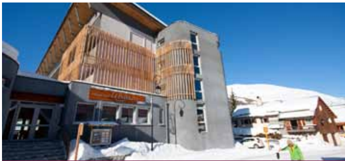
LA PULKA GALIBIER

Véritable pied de pistes, au coeur du grand domaine skiable Galibier Thabor avec 150km de pistes (dont 70% se situent au dessus de 2000 m) et 450 enneigeurs.