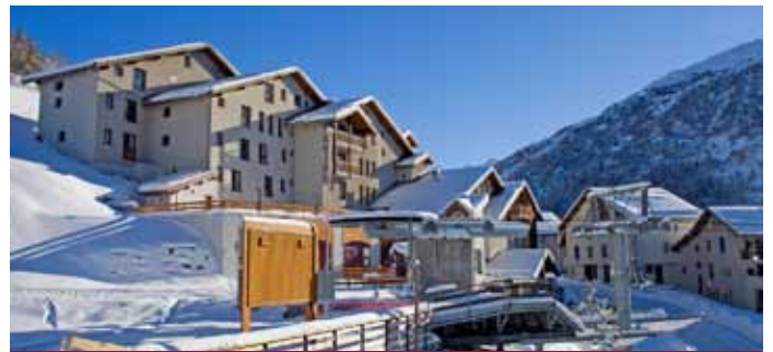
LA LAUZA THABOR

Au cœur des Alpes du Léman, à 30 minutes de Genève. Destination de moyenne montagne proche du lac Léman et des pistes de ski.