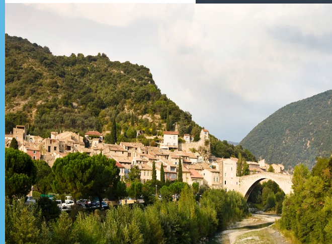
Les Cars de la Région Auvergne-Rhône-Alpes